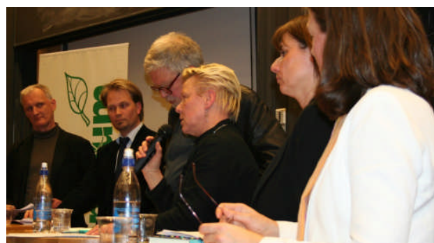
Debattpanelen på scen. Christer Owe (utanför bild) var moderator.

Här kan du se reportaget fram till den 6/3: http://tr4nyheterna.se/