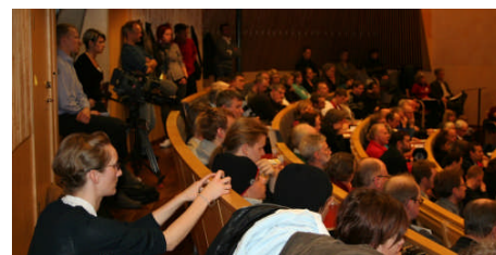
...för en fullsatt aula