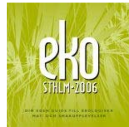
Ekoguide Sthlm 2006

På väg till Stockholm i sommar eller bor du i närheten? Då vill vi tipsa om EkoSthlm 2006 – en guide till ekologiska pärlor i form av caféer, restauranger, butiker, gårdar m m. Den "lilla gröna" går att beställa på www.ekolantbruk.se , klicka på Stockholms ekologiguide. Den är gratis och i perfekt format för väskan.