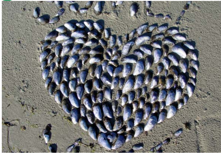
Musselhyärta. Blämusslor är goda att äta också...